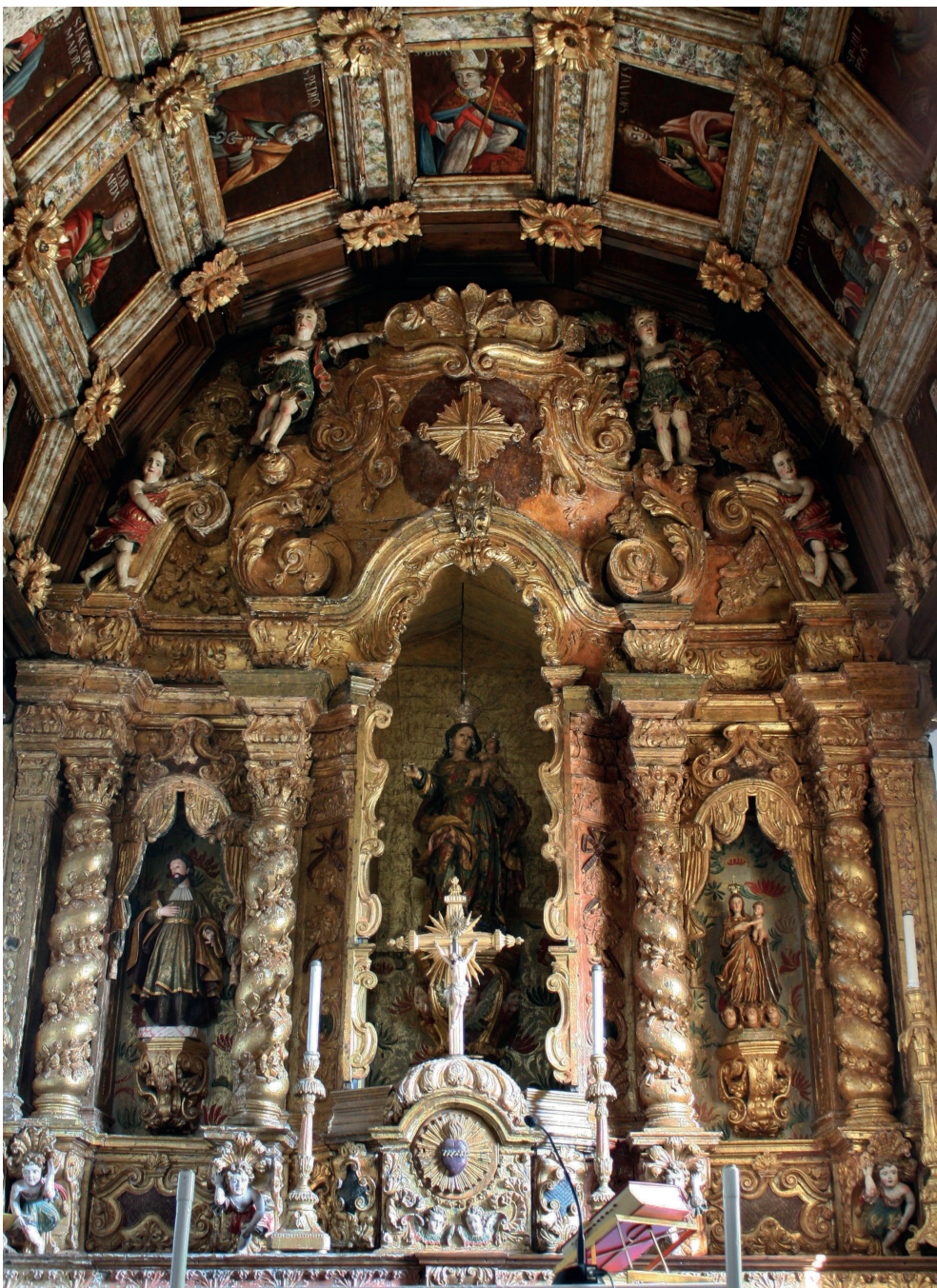
Pormenor do retábulo principal da capela de Nossa Senhora do Amparo, paróquia da Sé, Lamego.