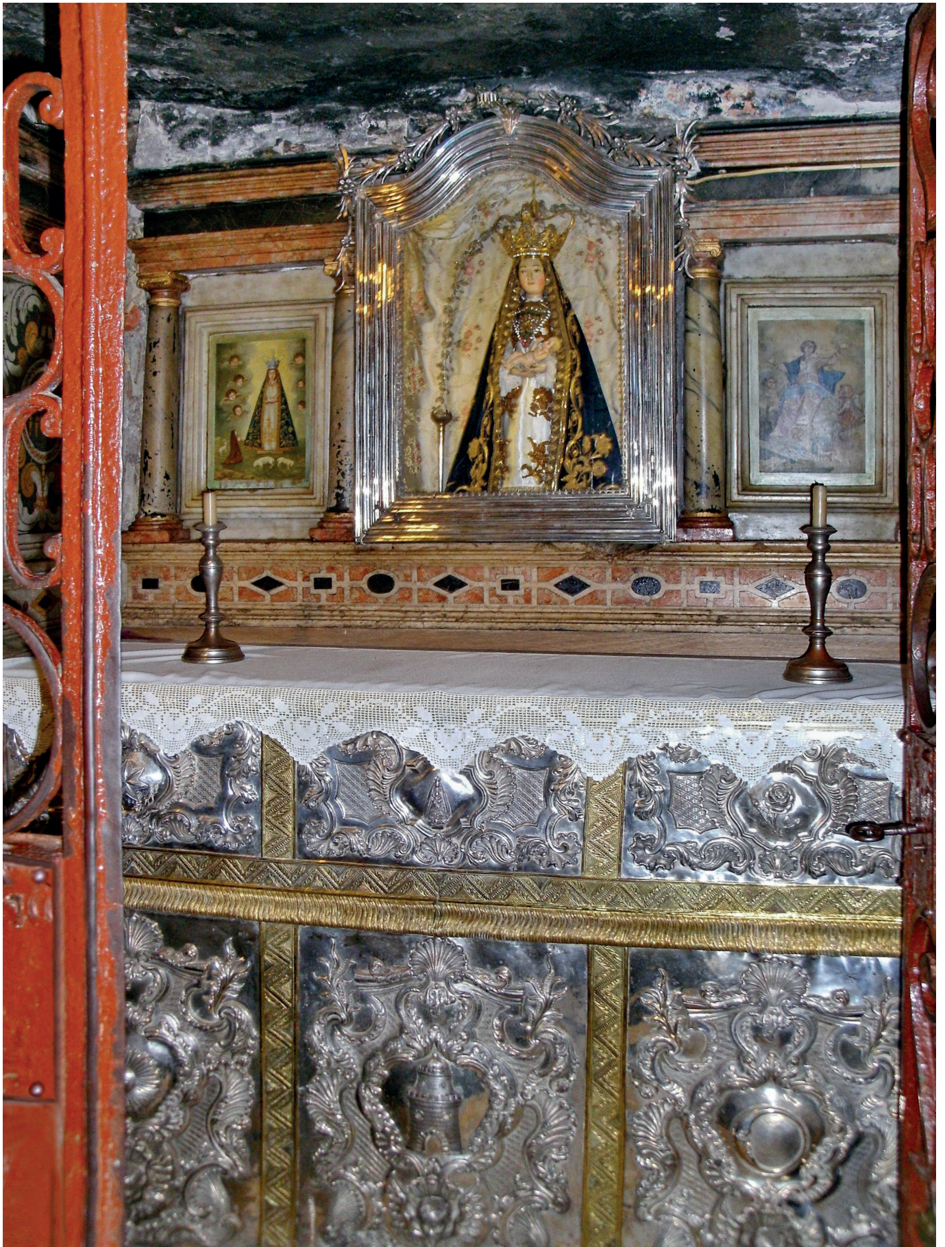
Retábulo principal do santuário de Nossa Senhora da Lapa, Sernancelhe, onde se destaca a diversidade de técnicas e materiais, mediante o uso de pedraria e prata. Salientamos ainda a utilização da ordem arquitetónica jónica e os símbolos marianos nas cartelas do frontal de altar.